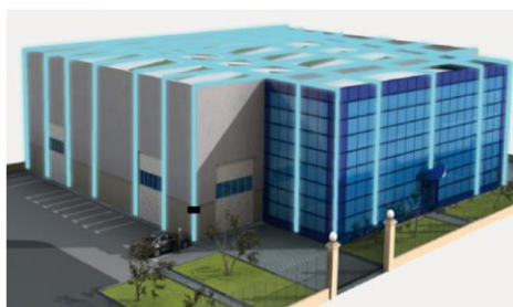
Edificio protegido mediante sistema de malla